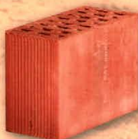
Kettősméretű / 19