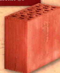
Kettősméretű / 24