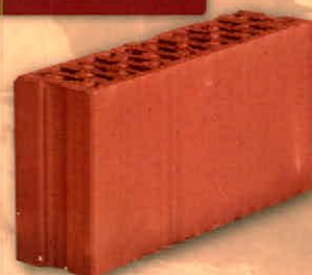
10/38/19 válaszfal 2010