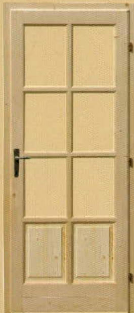
90/210 félig üvegezhető "M8"