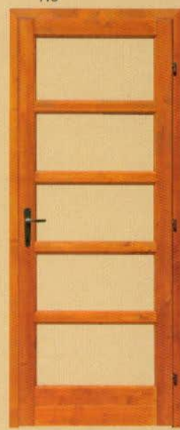
90/210 üvegezhető "E5"