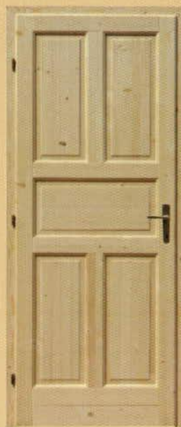
90/210 tele "M5"