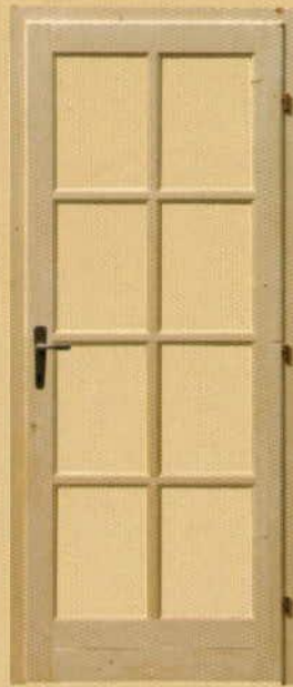
90/210 üvegezhető "M8"