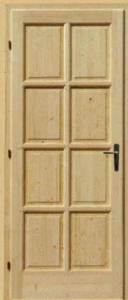
90/210 tele "M8"