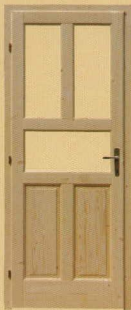
90/210 félig üvegezhető "M5"