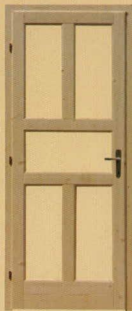
90/210 üvegezhető "M5"